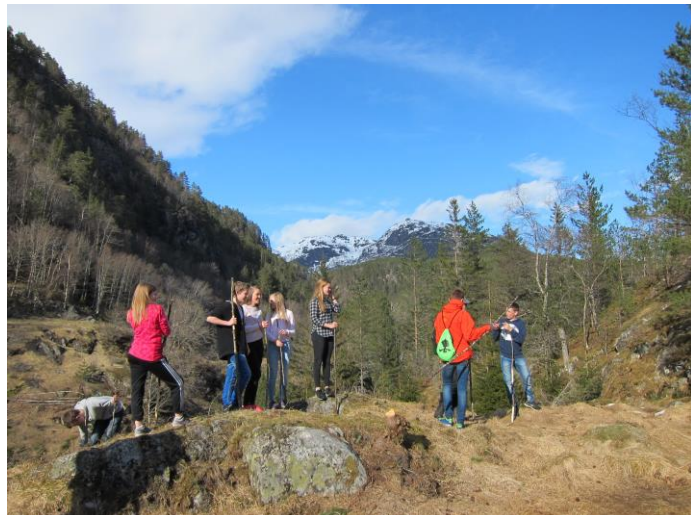
Frå pilegrimsvandring ved Mokleiv

Nokre gonger løyser me gruppeoppgåver, andre gonger ser me film, har drama eller griller pølser og diskuterer store og små spørsmål. Me ynskjer at du gjennom året skal læra meir og tenka igjennom tema knytt til m.a. tru/tvil, Bibelen, sjølvbilde, korleis ta gode val, oss i verda og andre tema knytt til Gud og kristen tru. Du treng ikkje å ha tenkt igjennom alt på førehand, men i løpet av året vil du få høve til å gjera deg opp eigne tankar og meiningar knytt til dette. Uansett: Det viktigaste er at du er villig til å delta i opplegget.