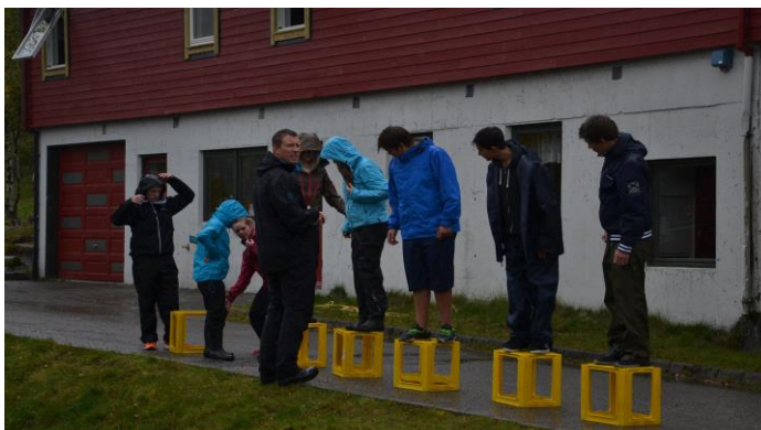
Frå weekend på Gullingen

Nokre gonger løyser me gruppeoppgåver, andre gonger ser me film, har drama eller griller pølser og diskuterer store og små spørsmål. Me ynskjer at du gjennom året skal læra meir og tenkja igjennom tema knytt til m.a. tru/tvil, Bibelen, sjølvbilde, korleis ta gode val, oss i verda og andre tema knytt til Gud og kristen tru. Du treng ikkje å ha tenkt igjennom alt på førehand, men i løpet av året vil du få høve til å gjera deg opp egne tankar og meiningar knytt til dette. Uansett: Det viktigaste er at du er villig til å delta i opplegget.